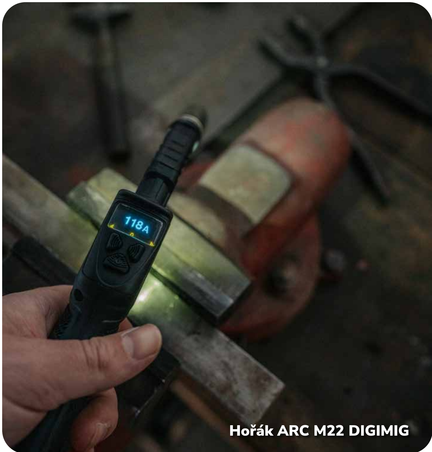
Hořák ARC M22 DIGIMIG